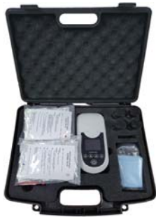
[ Full set 구성 ]