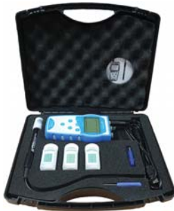
[ Full set 구성 ]