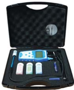
[ Full set 구성 ]